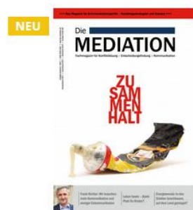
Die Mediation - Zusammenhalt

Hier finden Sie die neuesten vier Ausgaben unseres Magazins. Jede beinhaltet eine Leseprobe. Viel Spaß beim stöbern.