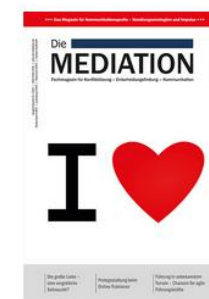
Die Mediation - Liebe