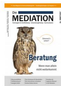
Die Mediation - Beratung