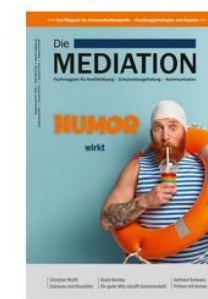
Die Mediation - Humor wirkt